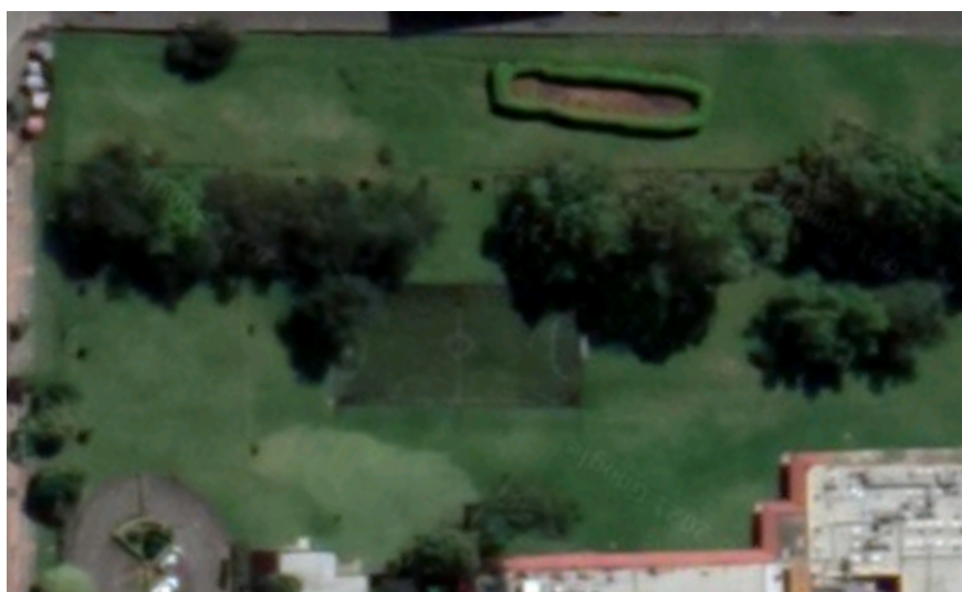
Figura 1 Ubicación dispuesta para el proyecto

El desarrollo del proyecto se adelantará dentro de las instalaciones de Vecol S.A. ubicado en la Avenida Calle 26 en la ciudad de Bogotá, área estimada destinada para el proyecto es de 1500m 2 de lote, 3100 m 2 de área construida para el edificio nuevo y para las áreas a rediseñar y remodelar se estiman 1600 m 2 aproximadamente (ver anexo 24), lo cual deberá ser viabilizado durante el desarrollo de las fases de diseño, contemplando cada una de las áreas requeridas de acuerdo con normativas aplicables al proyecto.